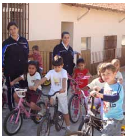
Amarelinha e aula de trânsito: apoio ao desenvolvimento integral.