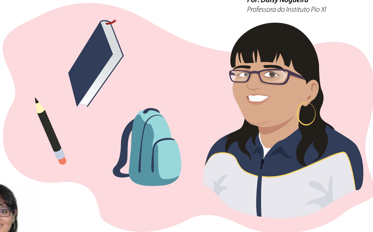
Ilustração: Flávio Torres Souto