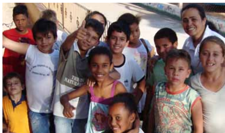
Projeto Ciranda I: acolhida, partilha, reflexão, liberdade, responsabilidade e cidadania.