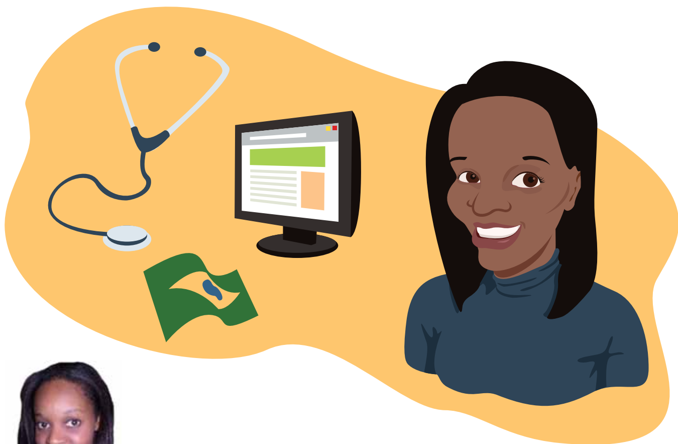
Ilustração: Flávio Torres Souto

Vida, aprendizagem e Educação alicerçam a minha formação.