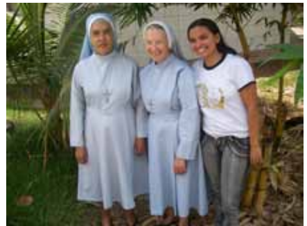
Contribuindo para a vida de pessoas que se sentem agraciadas por Deus.